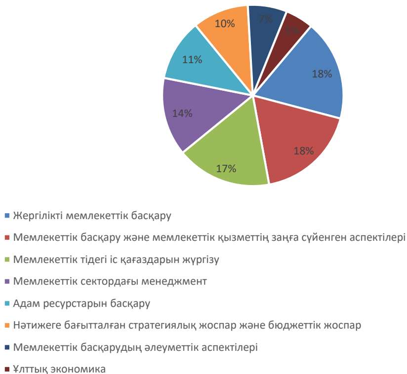
Сурет 2 – 2016ж Мемлекеттік басқару академиясындағы тыңдалған дәрістер көрсеткіші Ескерту: [4] әдебиет негізінде автор құрастырған

10 курс - қайта даярлау мәселесі бойынша өткізілді [4].