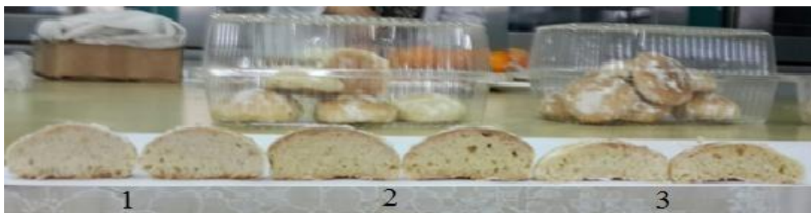
Рисунок 3 – Готовые изделия (вид в разрезе) с применением: 1- жира специального назначения «Oilprime 1003-32»; 2- маргарина «Экоуниверсал 1203-32»; 3- маргарина «Сливочный» (образец для сравнения)

Заварные пряники по органолептическим показателям имеют правильную форму, соответствующую данному наименованию заварного пряника, без вмятин; рифленую поверхность, с небольшими трещинами; золотисто-желтую окраску поверхности; вкус и запах изделий соответствует данному наименованию заварного пряника, без посторонних запахов и привкусов; при срезе изделия изнутри хорошо пропеченные, с хорошо развитой полостью.