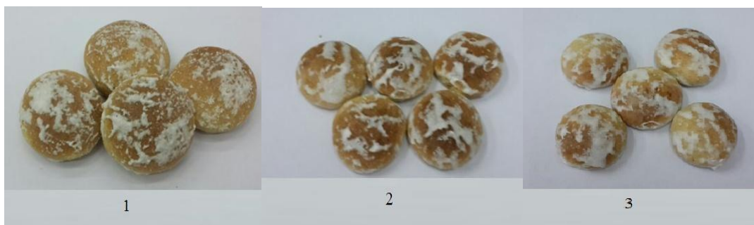
Рисунок 2 – Готовые изделия (вид сверху) с применением: 1- жира специального назначения «Oilprime 1003-32»; 2- маргарина «Экоуниверсал 1203-32»; 3- маргарина «Сливочный» (образец для сравнения)

ной выпуклой, обтекаемой формы изделий с равномерной пористостью, без пустот и следов непромеса, свойственных данному виду изделий по сравнению с контрольным образцом. По физико-химическим показателям все пробы готовых изделий, приготовленные с использованием маргарина «Экоуниверсал 1203-32» и жира специального назначения «Oilprime 1003-32» соответствовали ГОСТ 24901-2014. Готовые мучные изделия-пряники (вид сверху) и (вид в разрезе) представлены на рисунках 2-3.